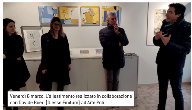
Venerdì 6 marzo. L'allestimento realizzato in collaborazione con Davide Boeri (Diesse Finiture) ad Arte Poli

Udine Design Week è un progetto promosso dal Museo del Design del Friuli-Venezia Giulia (MuDeFri) in collaborazione con il Gruppo Giovani Imprenditori di Confindustria Udine e con il sostegno di Banca di Udine, Fondazione Friuli, IFAP, Aspiag Nordest ed Emilia Romagna, Montbel.