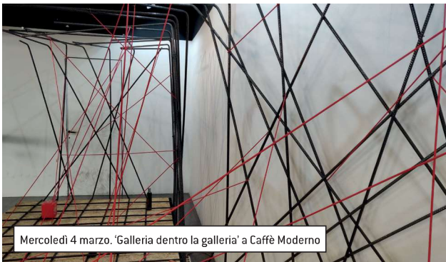
Mercoledì 4 marzo. 'Galleria dentro la galleria' a Caffè Moderno