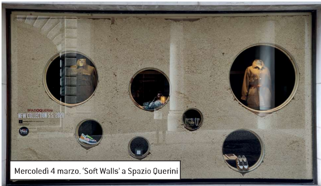
Mercoledì 4 marzo. 'Soft Walls' a Spazio Querini