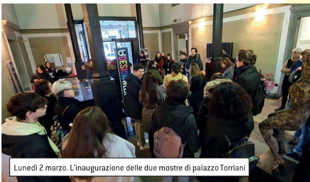
Lunedì 2 marzo. L'inaugurazione delle due mostre di palazzo Torriani