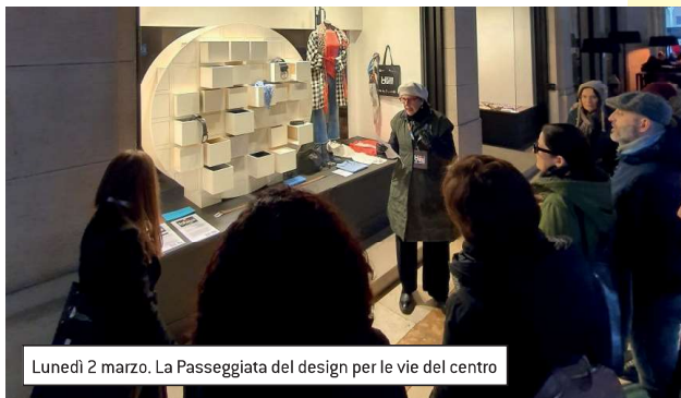
Lunedì 2 marzo. La Passeggiata del design per le vie del centro